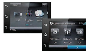
Vista del panel de control