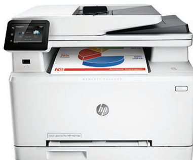
HP Color LaserJet Pro MFP M277dw

Nunca esperaría tanto rendimiento desde un formato tan pequeño. Este MFP (producto multifunción) u cartuchos de tóner HP Original con JetIntelligence se combinan para ofrecerle las herramientas que necesita para realizar el trabajo.