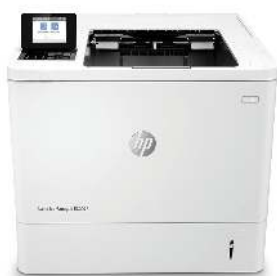
HP LaserJet Managed E60075dn

Esta impresora HP LaserJet con JetIntelligence combina un rendimiento excepcional y la eficiencia energética con documentos de calidad profesional justo en el momento en que los necesita, protegiendo la red con la mayor seguridad del sector. 1