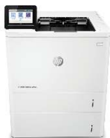
HP LaserJet Managed E60075x