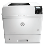
HP LaserJet Enterprise M606dn

Impulse los resultados comerciales y produzca una calidad de impresión superior. Ocúpese de trabajos grandes y equipe a grupos de trabajo para alcanzar el éxito, dondequiera que el negocio lo lleve. 2 Administre y amplíe con facilidad esta impresora súper rápida y versátil, y ayude a reducir el impacto ambiental.