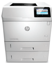
HP LaserJet Enterprise M606x