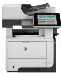
HP LaserJet Enterprise flow M525c MFP