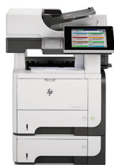
HP LaserJet Enterprise 500 M525f MFP