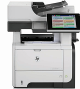
HP LaserJet Enterprise flow M525c MFP