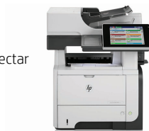
HP LaserJet Enterprise 500 M525dn MFP