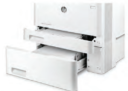
HP LaserJet Pro M452dn con bandeja de 550 hojas opcional