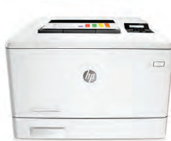
HP LaserJet Pro M452dn

Un rendimiento ideal de impresión y seguridad sólida para su forma de trabajar. Esta impresora en color compatible acaba los trabajos más rápido y ofrece amplia seguridad para la protección contra las amenazas. 1 Los cartuchos de tóner original HP con JetIntelligence producen más páginas. 2