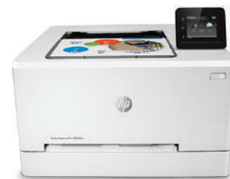
HP LaserJet Pro M254dw a color