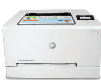
HP LaserJet Pro M254nw a color

Impresione con el color y aumente la eficiencia. Obtenga velocidades de impresión rápidas, incluido el tiempo de salida de la primera página (FPOT) más rápido de su categoría. 1,2 Cuente con soluciones de seguridad intuitivas, cree impresiones en color extraordinarias y obtenga una impresión móvil sencilla. 3