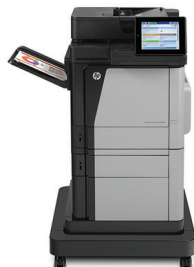
Impresora multifuncional HP Color LaserJet Enterprise M680f