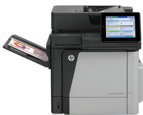
Impresora multifuncional HP Color LaserJet Enterprise M680dn

Afronte trabajos de gran volumen con esta impresora multifunc. color alto rendimiento. Impresión y copia, escaneo y fax 1 . Car. de escaneo mejoradas y pantalla táctil en color de 20 cm (8 pulgadas) con flujo de trabajo optimizado. Opciones de impr. móvil para mantener la produc. en sus viajes 2 .