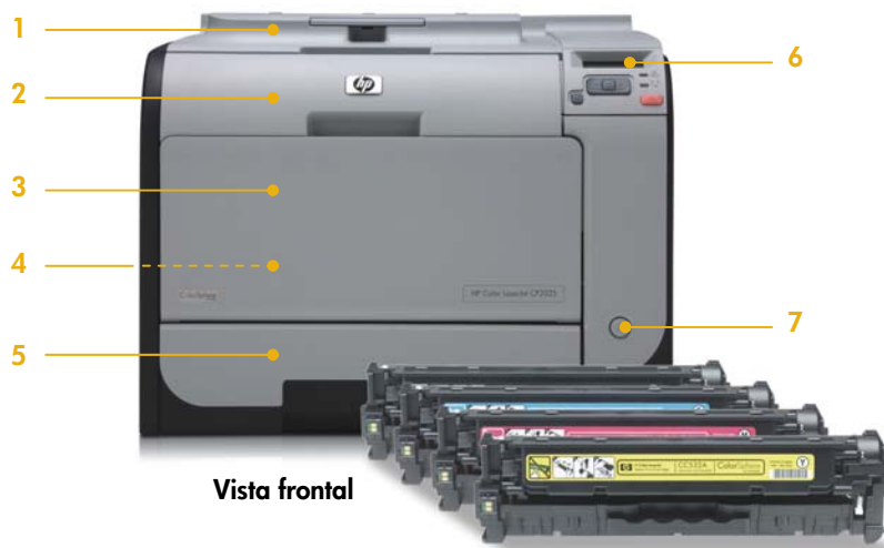
Imagen de la impresora HP Color LaserJet CP2025dn. En la tabla "La serie en resumen", más abajo, bandeja de entrada 3 opcional adicional.