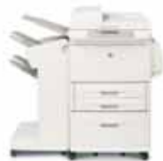
HP LaserJet 9040/9050mfp con finalizador apilador

Cada bandeja se puede asignar a un usuario, grupo de trabajo o departamento para que recoger los trabajos sea muy sencillo. El multibuzón clasificador también se puede configurar como clasificador/compaginador, apilador y separador de trabajos.