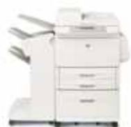
HP LaserJet 9050mfp con finalizador/apilador opcional

Para departamentos comerciales y de empresa, y múltiples departamentos de empresas medianas, con grupos de trabajo de 30 a 50 usuarios que requieran un acceso en red sencillo a funciones rápidas, fiables y económicas de impresión y copiado en blanco y negro hasta en A3, escaneado en color y una serie de opciones de fax, acabado de documentos y envío digital, para aumentar la eficiencia, mejorar la productividad y racionalizar los procesos de trabajo.