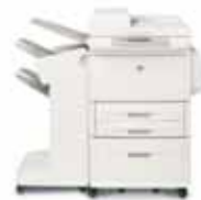
HP LaserJet 9040/9050mfp con finalizador/grapadora

Permite apilar hasta 3.000 hojas de papel con separación de trabajos.