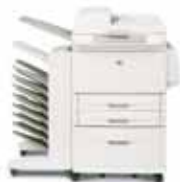
HP LaserJet 9040/9050mfp con buzón de 8 bandejas

Cable de alimentación, cartucho de impresión, documentación de la impresora, software de la impresora en CD-ROM, recubrimiento del panel de control, dos bandejas de entrada estándar de 500 hojas, una bandeja multipropósito de 100 hojas, bandeja de entrada de 2.000 hojas, accesorio de impresión automática a doble cara (preinstalado), servidor de impresión incorporado HP Jetdirect, alimentador automático de documentos. Debe elegir y solicitar el dispositivo de salida de papel deseado por separado.