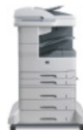
HP LaserJet M5035xs MFP