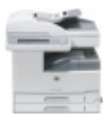
HP LaserJet M5035 MFP